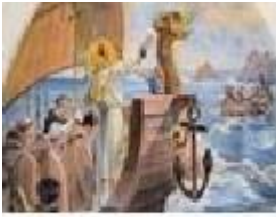
Fresque de St Symphorien dans la chapelle du Val André