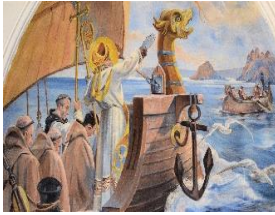
Fresque de St Symphorien dans la chapelle du Val André